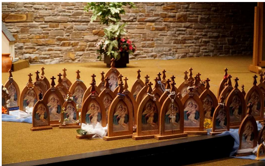
Aula pod Kościołem – nasze rodzinne świętowanie