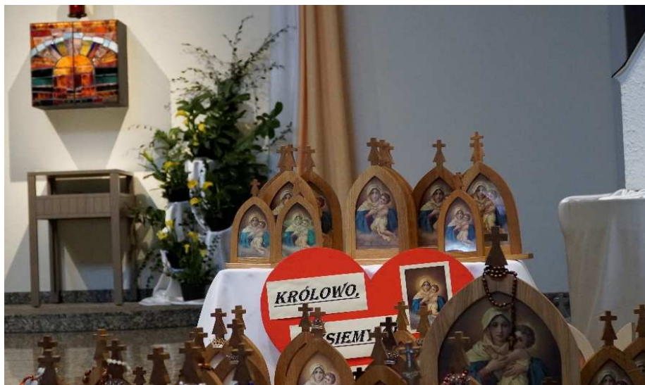
Pielgrzymujące sanktuaria w Kościele Pielgrzymkowym.