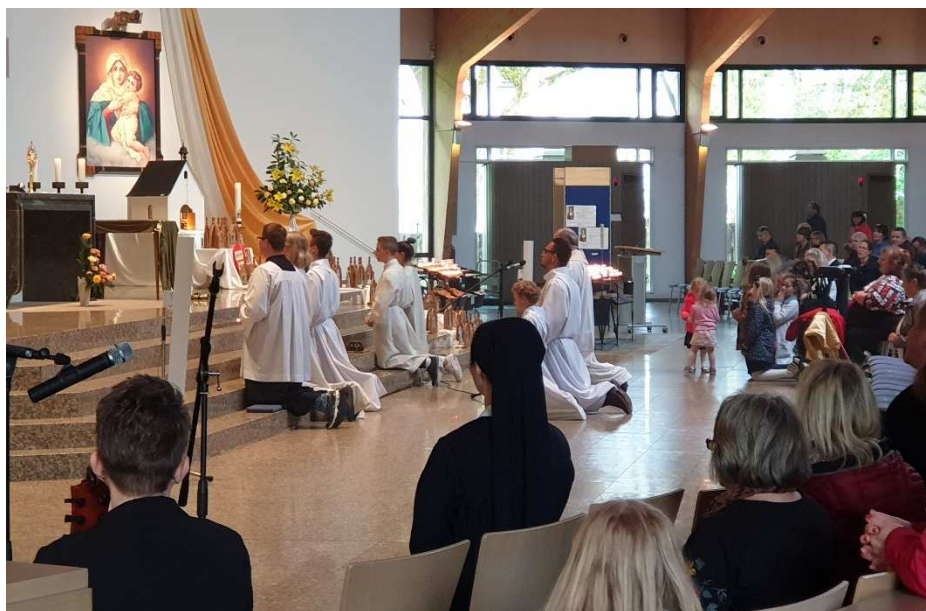
Adoracja Najświętszego Sakramentu, poprzedzająca uroczystą Eucharystię.