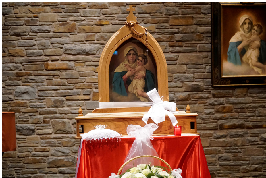
Królowo niesiemy Ci Koronę – feretron MTA i Korona dla Matki Bożej Apostolatu z Berlina.