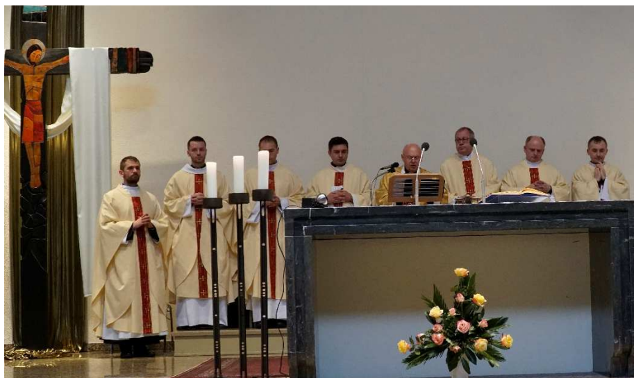
Msza święta z postaniem nowych pielgrzymujących sanktuariów miała miejsce w Kościele Pielgrzymkowym.