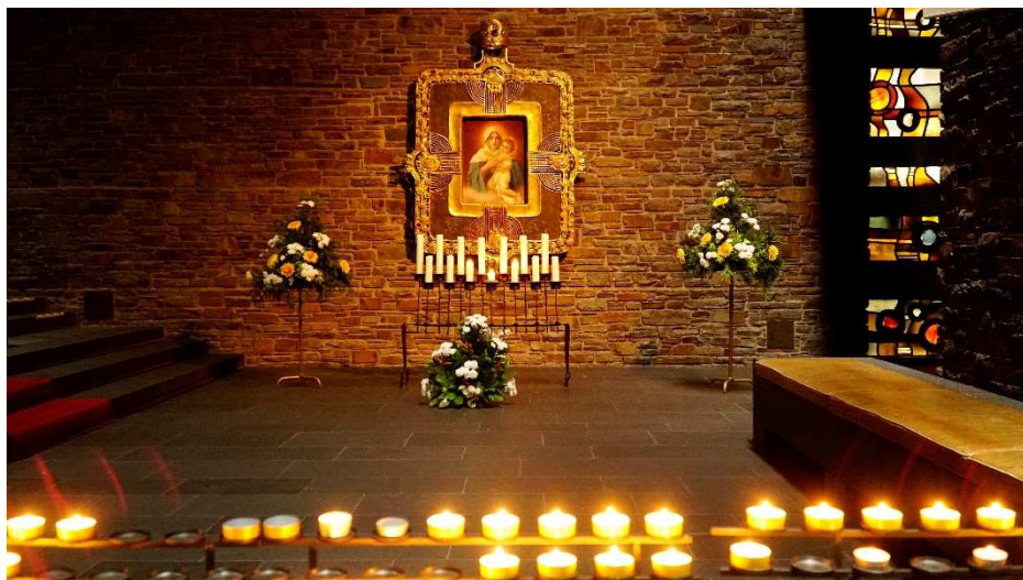
Kościół Adoracji – początek świętowania.